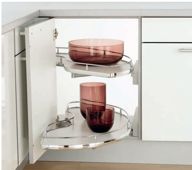
Nutzt den Stauraum in der Ecke: Slide Corner von Vauth-Sagel

Vauth-Sagel GmbH & Co. KG 33034 Brakel-Erkeln Tel.: (05272) 601-01, Fax: -193 www.vauth-sagel.de