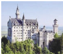
Alpenkitsch? Neuschwanstein steht immerhin auf der Anwärterliste zum Weltkulturerbe

Der Sanitärbereich einer touristischen Mega-Attraktion wie Schloss Neuschwanstein muss einiges aushalten: 6000 Besucher pro Tag. Die Bayerische Schlösserverwaltung setzt auf Varicor.