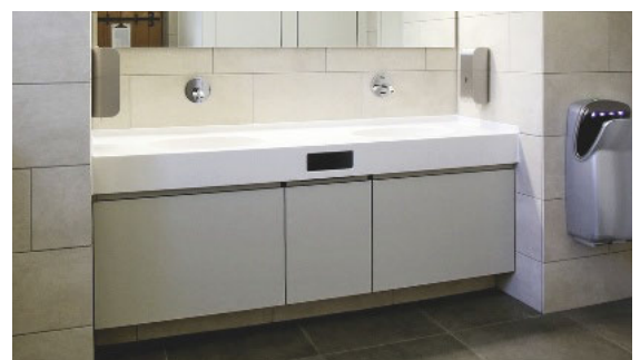
Varicor-Waschtisch, Unterbau aus HPL-Vollkernmaterial