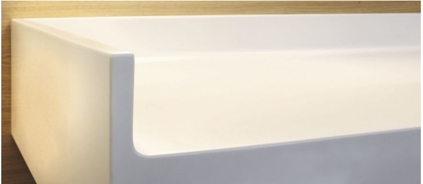
Hoher Hygienestandard für hohe Besucherfrequenz: fugenloser Wickeltisch aus Varicor, mit reinigungsfreundlicher Hohlkehle